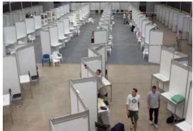
Figura 2. Tipo de stands en ExpoCiencias Nacional 2011, para ubicar la visual de los proyectos.

En el evento nacional, los stands serán decorados y ornamentados sobriamente, evitando el uso de globos, grandes moños u otros que puedan tapar la visual de los proyectos (Figura 2).