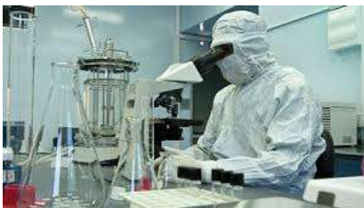
Figura 1. La trayectoria educativa para operar el modelo didáctico.

Cada dibujo, gráfica o fotografía se agregan sin o con marco y una explicación breve el pie de figura (Figura 1). Se separa del texto normal con un espacio.